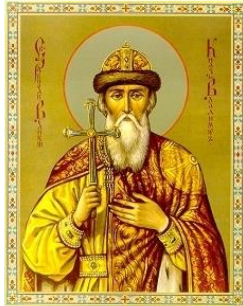
Saint Égal-aux-Apôtres Volodymyr le Grand, dans le Saint Baptême, Basile, Grand-Knyaz' de Kyiv (1015)

On July 28 on the Gregorian Calendar (which is July 15 on the Julian) we celebrate the Baptizer of Kyivan Rus' the Great Knyaz' Volodymyr, who, like his grandmother, St. Ol'ha, is titled "Equal-to-the-Apostles" (Ukrainian "Rivnoapostol'nyy", Greek "Isapostolos"). This great man was chosen by God to play a key role in the unfolding destiny of the Ukrainian, Belarus and Russian